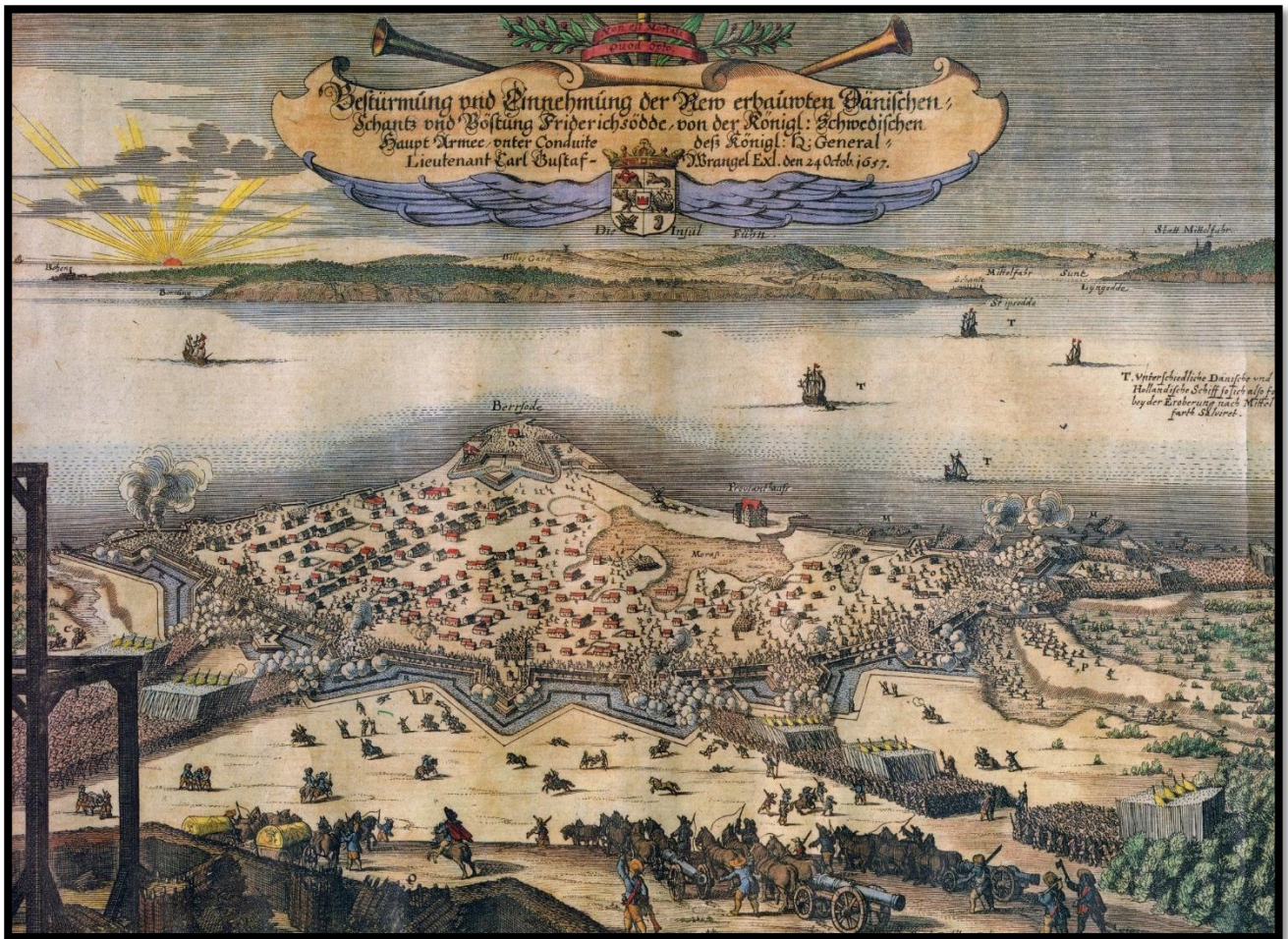
Svenskerne stormer Fredericia. Tegning: Erik Dahlberg.

Kl. 5 om morgenen den 24. oktober gav general Wrangel ordre til storm. Man lavede tre angreb på én gang. Mod nordøst ved Kongens Port, midt på volden ved Prinsens Port og mod syd ved Lillebælt. Her var volden ikke bygget færdig endnu, og de svenske ryttere kunne derfor ride ud i vandet og uden om de svage palisader. Herefter kunne de angribe danskerne i ryggen og åbne byens porte indefra.