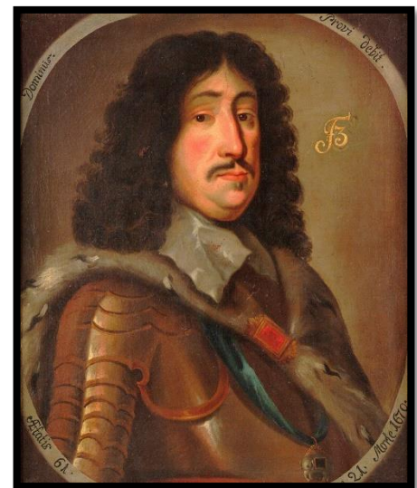
Frederik den 3.

Byen og volden blev bygget fra 1650-1657. Først senere kom byen til at hedde Fredericia.