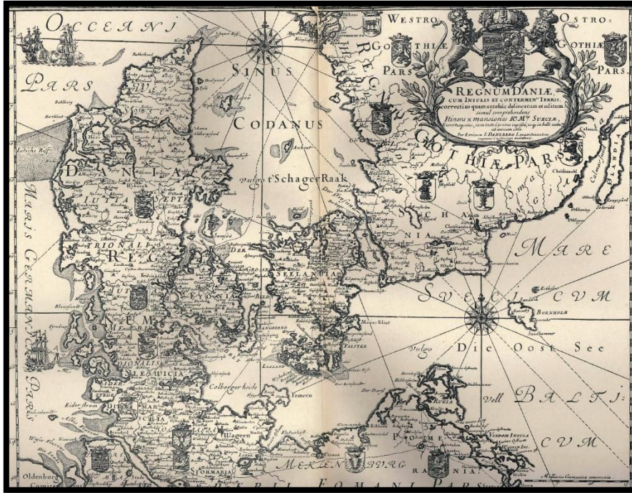
Danmark i 1600-tallet.

I 1600-tallet var Sverige Danmarks største fjende. De to lande ville begge have magten over Østersøen, og de gik derfor i krig i både 1563-70, 1611-13 og 1643-45. På grund af krigen var hele Jylland flere gange besat af fjendtlige soldater.