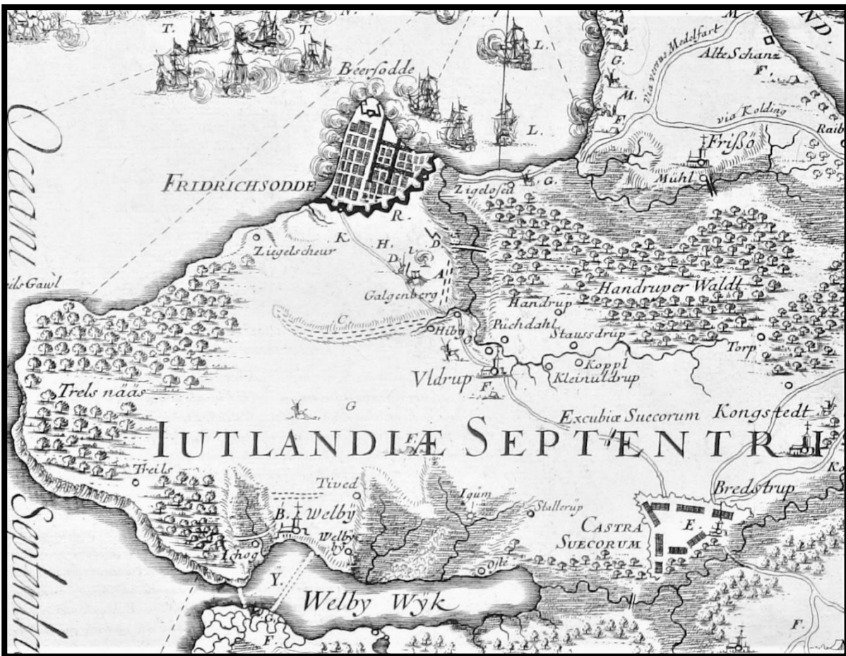
Svenskernes lejr nederst i billedet til højre. Tegning: Erik Dahlberg.

Soldaterne lavede en kæmpe lejr ved Bredstrup med byens kirke som centrum. Lejren var lige så stor hele Frederiksodde inden for voldene.