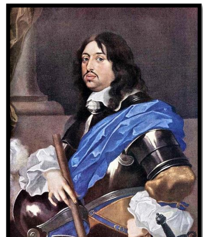
Karl Gustav den 10.

I 1657 håbede Frederik den 3., at han kunne vinde det tabte land tilbage. Den svenske kong Karl Gustav den 10. var nemlig i krig i Polen, og danskerne kunne måske derfor vinde med en hurtig krigserklæring .