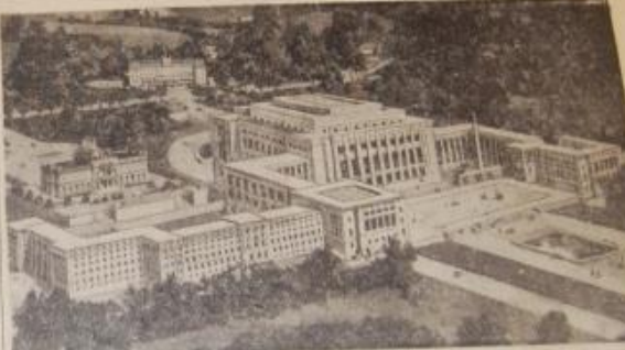
FOLKEFORBUNDETS BYGNING I GENEVE, hvor den store Konferens afsluttes den 20. April. Delegationer fra Klodens fem store Stater er undervejs. Forhåbentlig endes Konfliktene i 43 Døgn. Oden her deres Løsning, og 30% om denne Bygning er kostene af et Fald fra det Høje Fredsforløb, haaber man, at Konferensen denne Gang kan give et Resultat, der kan indløse en Afspænding af haarde hvide og varme Krige.

Dagens Ord: Lad ingen med din gode Vilje gaa bedrøvet fra dig.