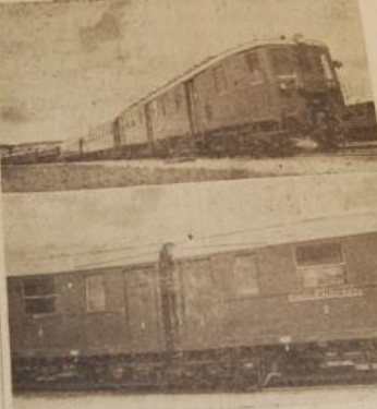
Den nye »Engländer«, der for Fremtiden skal betjene Ruten København - Vejle og omvendt, er herhjemme i Læsø i aftenstund.