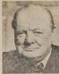
Winston Churchill - han kan endes